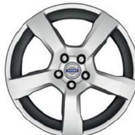
Cratus 8,0 x 20"

Navedene cene so informativne. Maloprodajne cene so informativne.