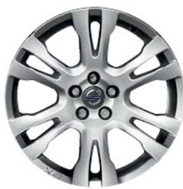
Thalia 7,0 x 18"