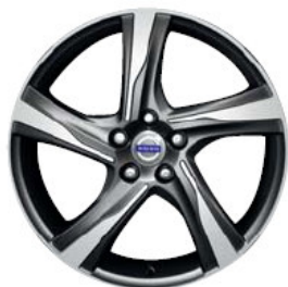
Ixion 8,0 x 19"