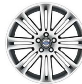
Galateia 8,0 x 19"