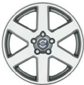
Neptune 7,0 x 17"