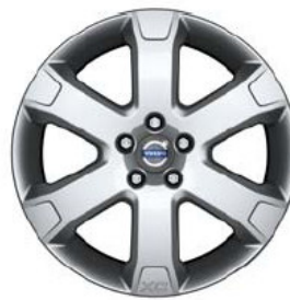
Situla 7,0 x 18"