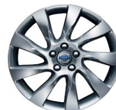
Magni 8,0 x 18"