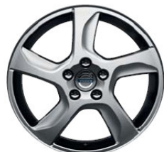
Balder 7,0 x 17"