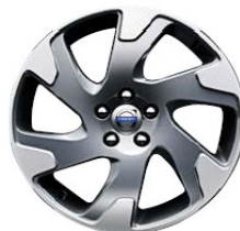
Argus 8,0 x 18"