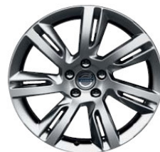
Sleipner 8,0 x 18"