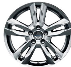
Njord 8,0 x 17"