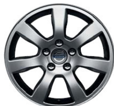
Oden 7,0 x 16"