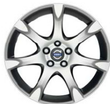
Fortuna 8,0 x 18"