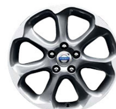
Pontos 7,5 x 17"

Navedene cene so informativne. Maloprodajne cene so informativne.