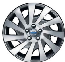
Saga 7,0 x 17"